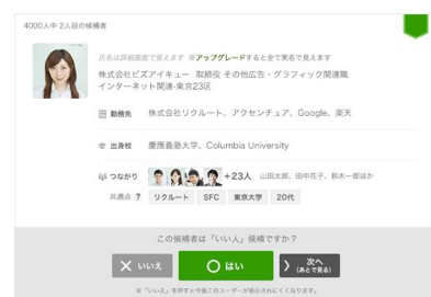
Biz-IQタレントファインダー管理画面 ※Biz-IQ会員、Facebookから候補者を表示

リクルートキャリアではこれからもひとりひとりにあった「まだ、ここにはない、出会い。」を届けることを目指していきます。